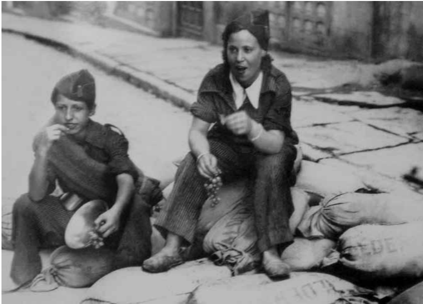
Dos milicianas españolas en descanso comiendo uvas en Toledo

que poseía España todavía en el siglo XIX y principios del XX. En primer lugar, era un país predominantemente agrario, con grandes focos industriales en el norte y en Cataluña, pero con una economía atrasada, basada en la agricultura. Ni siquiera los grandes negocios realizados durante la Primera Guerra Mundial, debido en gran parte a la neutralidad, fueron aprovechados para modificar la vieja estructura agraria y subdesarrollada que regía en gran parte del territorio español. La explotación de las mujeres era aún mayor debido a la mala alimentación, los bajos salarios, la falta de ayudas por maternidad y las enfermedades, que imposibilitarían a cualquier mujer española concretar una vida digna.