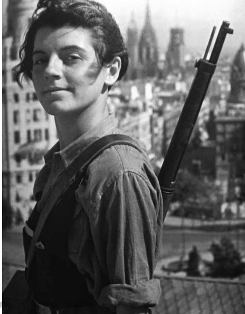
Miliciana española en el frente de Barcelona a finales de 1936